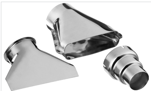
Набор насадок в комплекте для различных видов работ