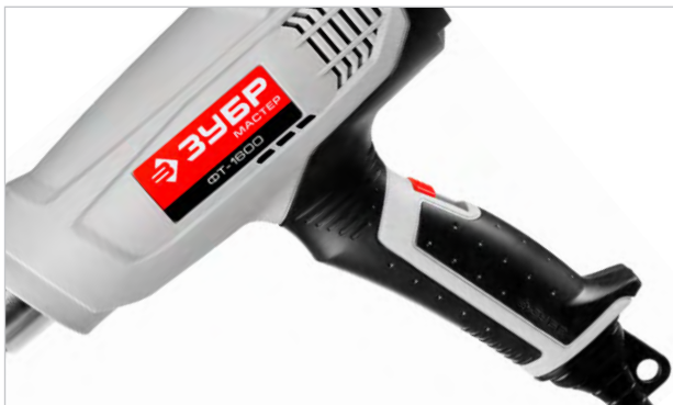
Эргономичный дизайн для комфортной работы