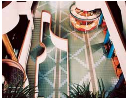
Фарфоровая неглазурированная плитка, укладываемая с помощью Kerabond T + Isolastic Общественное здание – Город Норс Йорк Онтарио (Канада)