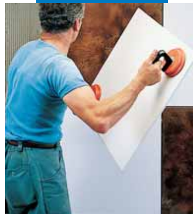
Укладка Keraion на стену