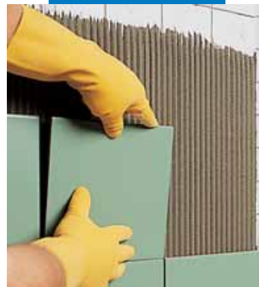
Нанесение поверх старой плитки