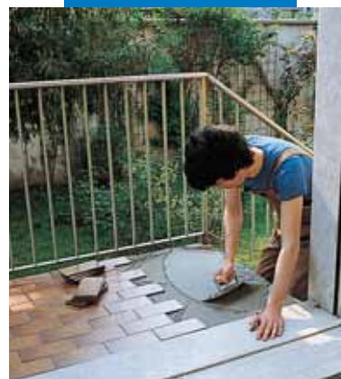
Гидроизоляция и укладка плитки с помощью смеси Kerabond T + Isolastic