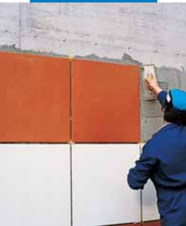
Укладка крупноформатной плитки с помощью Kerabond T + Isolastic