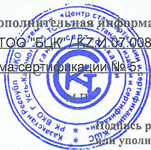
Схема сертификации № 5

Подпись руководителя органа по подтверждению соответствия