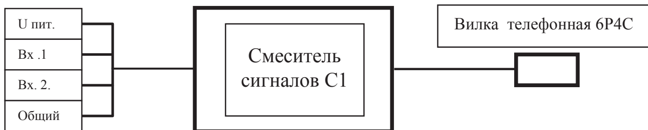
Схема 4.1 Выводы Смесителя сигналов С1

На схеме 4.1 показано обозначение выводов Смесителя сигналов С1.