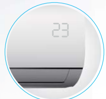
Светящийся встроенный дисплей