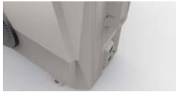
Оригинальная «граненая» форма.