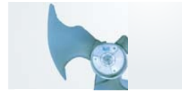
Продуманный бионический дизайн лопастей вентиля- тора. Форма «подсмотрена» в природе, поэтому очень эффективна.