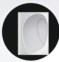
Оригинальные боковые поверхности