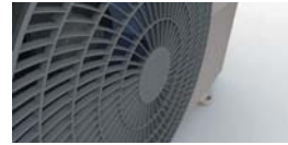
Особая форма воздуховыпускной решетки.