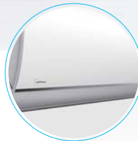
Незаметное воздуховыпускное отверстие