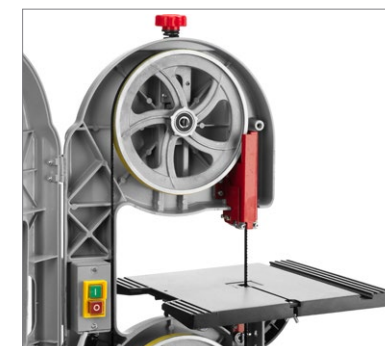
Надежный, легко регулируемый механизм станка