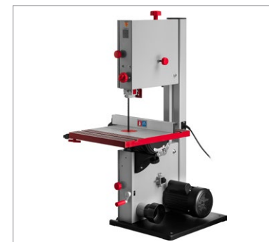
Конструкция пилы обладает повышенной жёсткостью