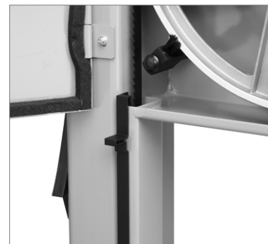
Уплотнение крышек, специальная вставка и щетки защищают механизм станка от пыли