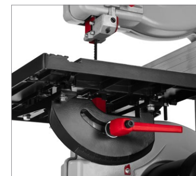
Удобное крепление направляющей. Простая регулировка положения стола