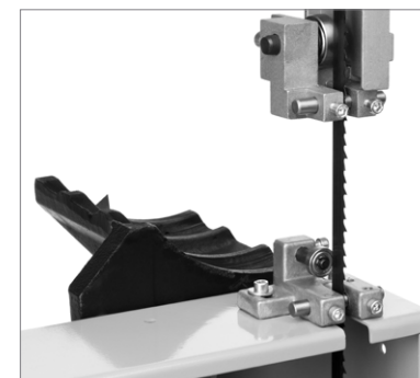
Направляющие штифты и подшипники обеспечивают равномерность реза