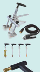
Manuspot Арт. 050679