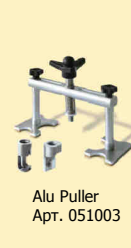
Alu Puller Арт. 051003