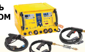
Speedliner Combi 230 E Pro - Арт.035072