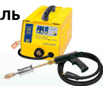
Speedliner 39.02 - Арт.035010 Speedliner 39.04 - Арт.035027