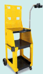
Тележка Spot 1600 Арт. 051348