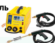
Speedliner PRO 230 - Арт.035034 Speedliner PRO 400 - Арт.035041