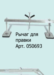
Рычаг для правки без крючков Арт. 050686