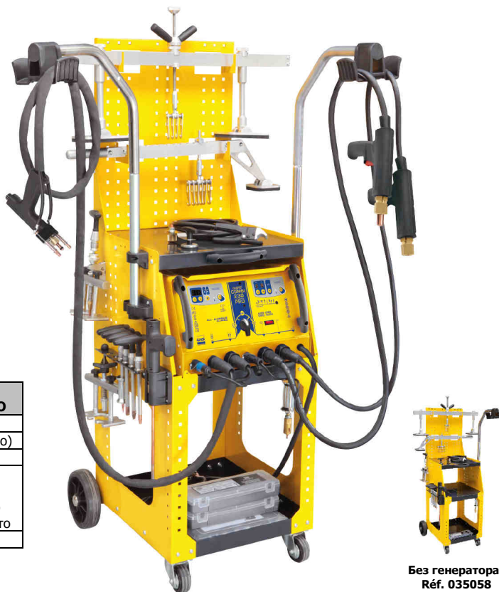
Без генератора Réf. 035058