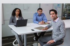
Professional Services for Microsoft Solutions