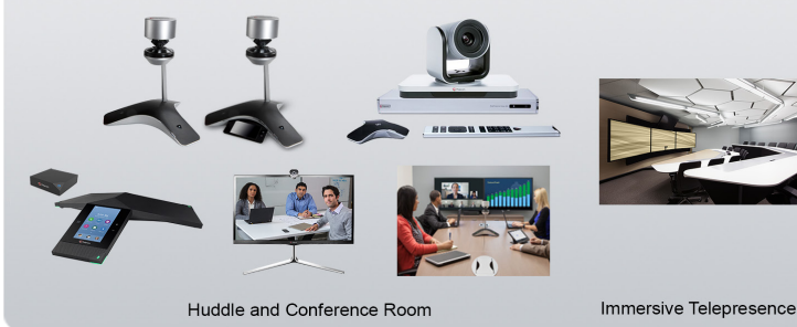
Huddle and Conference Room