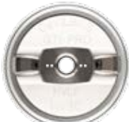
HV30 HVLP Luftkappe