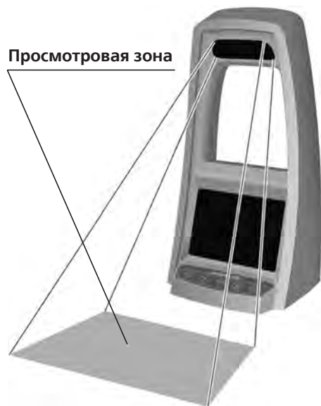
Рисунок 3 Расположение просмотровой зоны прибора

запрещено). Интервал изменяется кнопками «+» и «-» с шагом 10 мин. Поместите банкноту в ПРОСМОТРОВУЮ ЗОНУ, как показано на рис. 3.