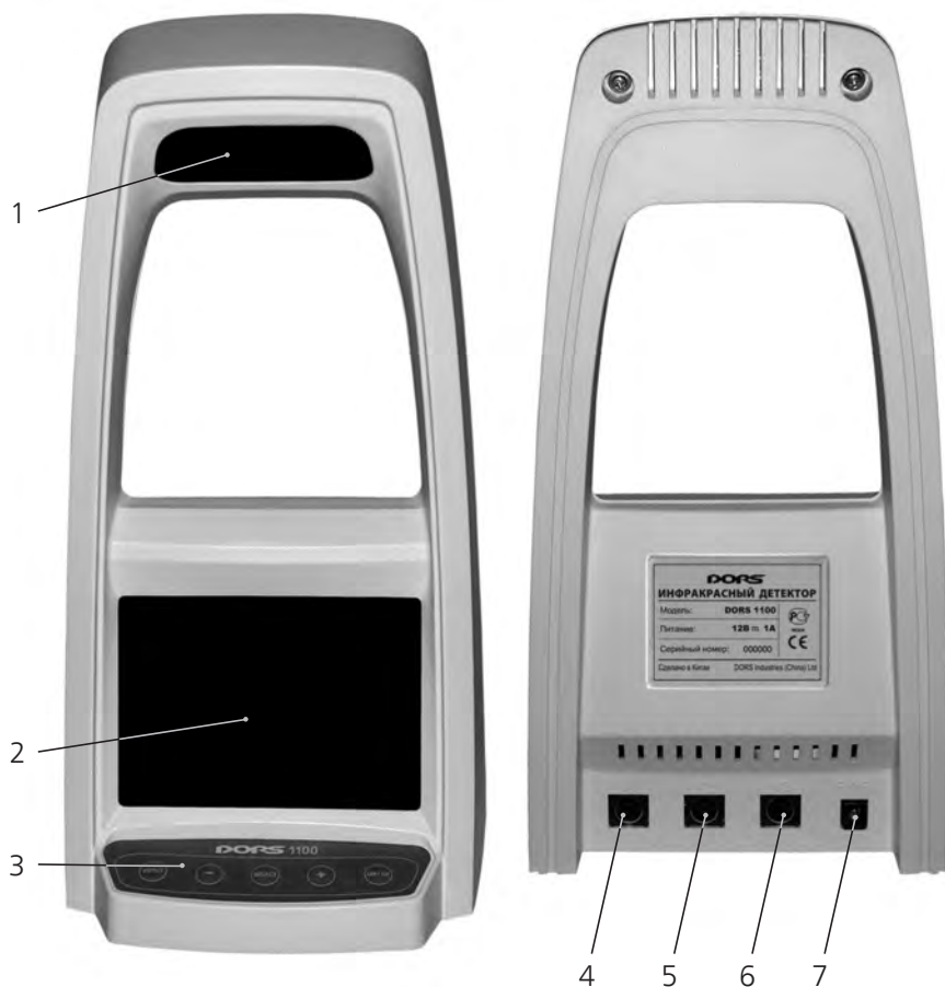
Рисунок 1 Компоненты прибора