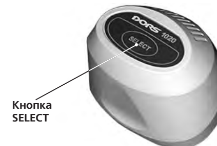
Рисунок 5 Телевизионная лупа DORS 1020

ПРИ ПОДКЛЮЧЕНИИ DORS 1010 ИЛИ DORS 1020 К ДЕТЕКТОРУ DORS 1100 ДЕТЕКТОР ДОЛЖЕН БЫТЬ ОТКЛЮЧЕН ОТ СЕТИ ЛИБО НАХОДИТЬСЯ В ДЕЖУРНОМ РЕЖИМЕ