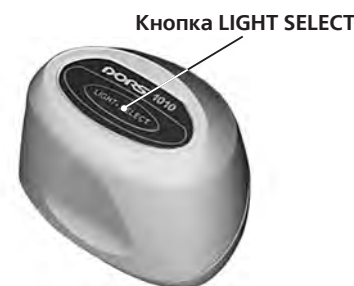
Рисунок 4 Телевизионная лупа DORS 1010

Телевизионная лупа DORS 1020 (рис. 5) подключается ко входу V1 и позволяет проверять наличие инфракрасных (ИК/IR) и ультрафиолетовых (УФ/UV) меток в отраженном свете, проверять поверхность банкнот и др. объектов в белом коспадающем свете, контролировать наличие микропечати. Подключить лупу DORS 1020 к гнезду V1 на задней панели прибора.