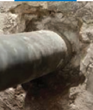
Выполнение штрабы вокруг трубы