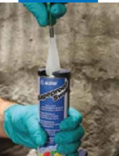
Прокалывание защит- ной мембраны на трубе Мареproof Swell