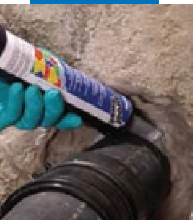
Нанесение Мареproof Swell вокруг трубы