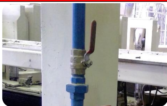
Шаровой кран ДУ<50