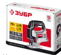
Упаковка: картонная коробка