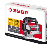
Упаковка: картонная коробка