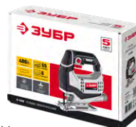
Упаковка: картонная коробка