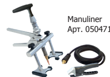
Manuliner Арт. 050471