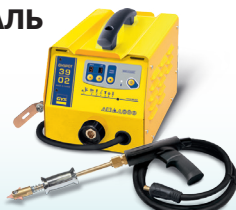
EASYLINER 39.02 - Арт. 053618