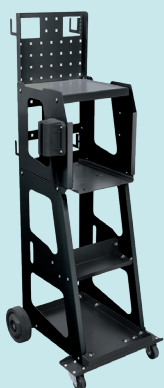
Тележка Spot 1000 Арт. 053540