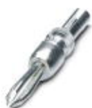
Тестовый штекер, с выводом под пайку сечением до 1 мм 2 , цвет: серый