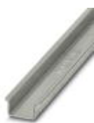
Несущая рейка без перфорации, Стандартный профиль 2,3 мм, ширина: 35 мм, высота: 15 мм, согласно EN 60715, материал: Сталь, оцинкован., пассивирован., длина: 2000 мм, цвет: серебристый

Несущая рейка без перфорации - NS 35/15-2,3 UNPERF 2000MM - 1201798