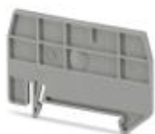
Разделительная пластина, длина: 59,8 мм, ширина: 2 мм, высота: 39 мм, цвет: серый

Разделительная пластина - ATP-ST 4 - 3030721