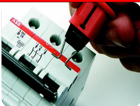
Полюсный автомат с узким разъемом