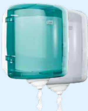
Диспенсер Tork Reflex™ с центральной вытяжкой (M4) Арт. 473180, Голубой Арт. 473190, Белый