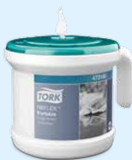
Переносной диспенсер Tork Reflex™ с центральной вытяжкой (M4) Арт. 473186