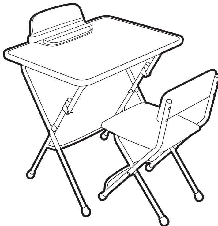
(рис. 1) арт. КУ2/ПА

Перед эксплуатацией следует ознакомиться с паспортом и руководством по эксплуатации. Следуя инструкции, выполните установку стола и стула.