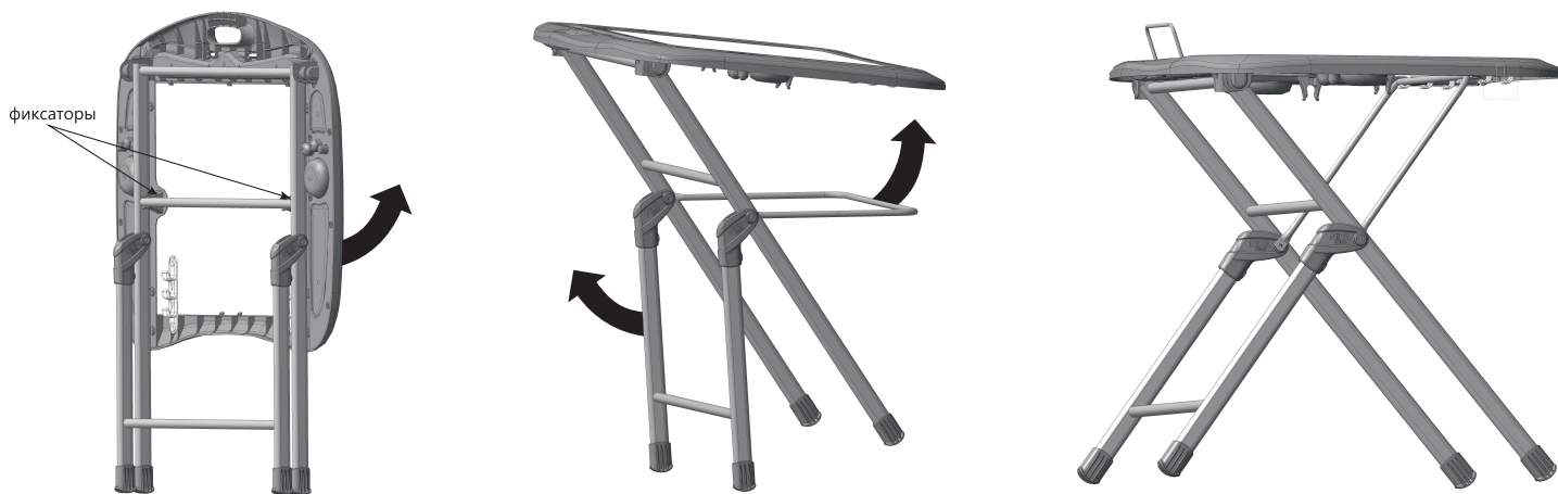
(рис. 2) Схема раскладывания стола

подпись ответственного лица, штамп торгующей организации