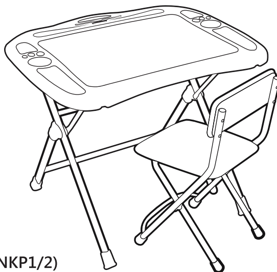
(рис. 1) Комплект (арт. НКР1/1, НКР1/2)

Перед применением следует ознакомиться с паспортом и руководством по эксплуатации. Следуя инструкции, выполните установку стола и стула.