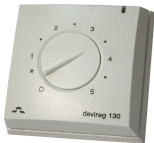
Рис. 2. Электронный терморегулятор без таймера DEVireg™ 130.