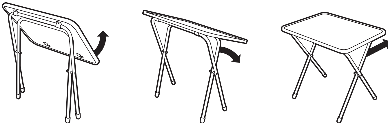
Рис. 3 Схема раскладывания стола Арт. Д1, Д2

Соответствует требованиям ТР ТС 025/2012 «О безопасности мебельной продукции» ТУ 561812-001-84597115-2014. Модели: СН, СНТ, СВ, СВМ. Сведения о документах, подтверждающих соответствие, указаны на сайте изготовителя. Сделано в России.