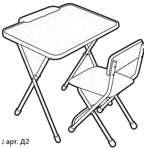
Рис. 2 арт. Д2

Перед эксплуатацией следует ознакомиться с паспортом и руководством по эксплуатации. Следуя инструкции, выполните установку стола и стула.