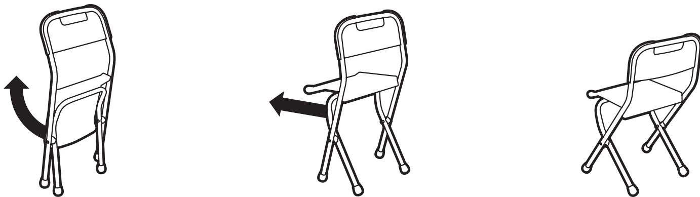
Рис. 4 Схема раскладывания стула с пластмассовым сиденьем Арт. Д1