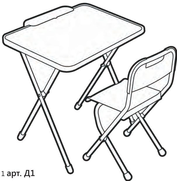
Рис. 1 арт. Д1