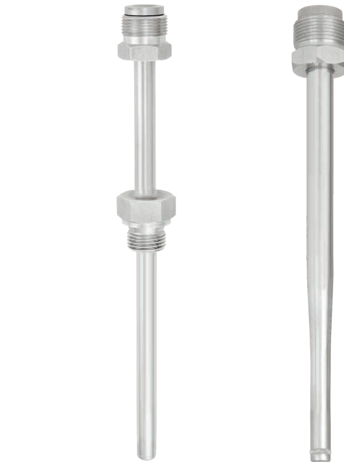
Рис. слева: резьбовая гильза, модель TW35-4 (форма 2G)

Благодаря наличию широкого ассортимента опций конструкций и материалов пользователь может подобрать оптимальный вариант гильзы для специальных условий применения. Выбор гильзы зависит от типа технологического соединения (фланцевое, резьбовое и стерильное соединение) и условий производственного процесса. Основные варианты конструкции представлены резьбовыми, приварными и фланцевыми гильзами.