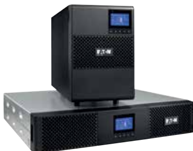
9SX модели стойка и башня