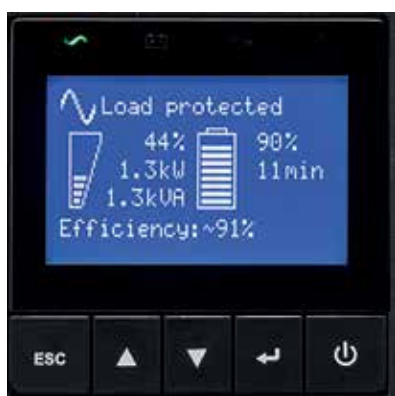
9SX графический ЖК-дисплей