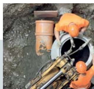
Применение вне помещений

Еще больше информации онлайн об областях применения EverBOX Grip, а также о других наших мобильных дистрибьюторах, промышленных разъемах и решениях высочайшего качества - на нашем веб-сайте.