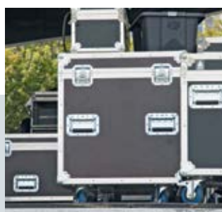
Проведение культурно-массовых мероприятий