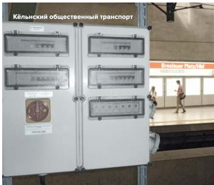
Кёльнский общественный транспорт