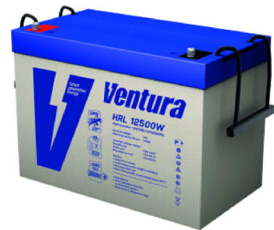
Габаритные размеры, мм

Примечание: приведены средние значения, полученные в течение трех циклов заряда/разряда Производитель оставляет за собой право вносить изменения в связи с проводящимися мероприятиями по оптимизации типов