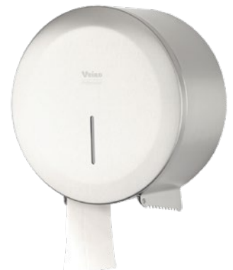
VEIRO JUMBO STEEL

Широко применяется в местах общественной гигиены с высокой и средней проходимостью в Офисных и Административных зданиях, заведениях сегмента HoReCa, Медицинских учреждениях, на объектах Транспорта, Спортивных объектах.