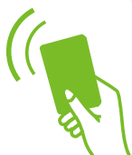
Система контроля доступа

Новый турникет-трипод с компактной конструкцией, позволяющей уменьшить занимаемую площадь, весь корпус изготовлен из нержавеющей стали и является долговечным. Интегрирован со световым индикатором входа на видном месте для направления прохода. Турникет автоматически опускает планку при возникновении чрезвычайных ситуаций.