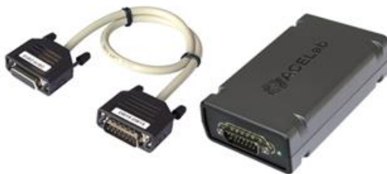
Мультиплексор «MUX CAN+KLine» с кабелем «DB15-DB15»