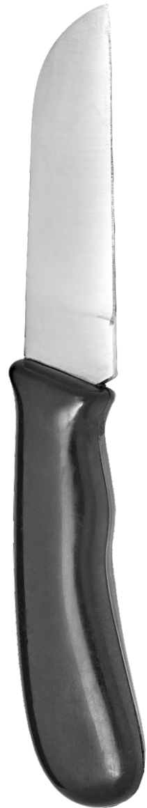
Нож зуботехнический большой Dental knife, big 08.0050.20 200 mm