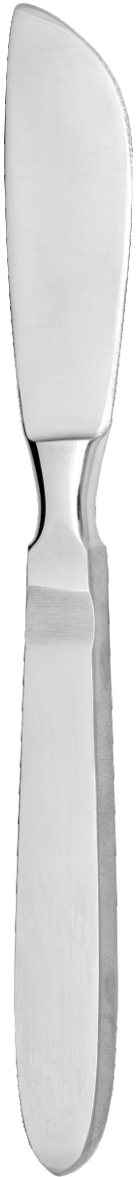
Нож хрящевой реберный Cartilage and rib knife 08.0042.02 205x75 mm