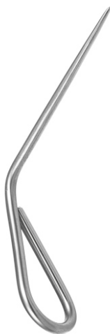
Зонд ушной остроконечный по Воячеку Voyacheck's pointed ear probe