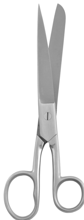
Ножницы для перевязочного материала, Смит Smith bandage scissors, straight

24.0041.03* 160 mm 24.0041.04* 180 mm 24.0041.05* 200 mm