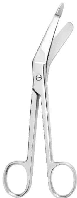
Ножницы для разрезания повязок с пугвкой, горизонтально-изогнутые Bulbous-end Bandage scissors, horizontal curved

24.0013.14* 140 mm 24.0013.16* 160 mm 24.0013.19 185 mm 24.0013.20* 200 mm