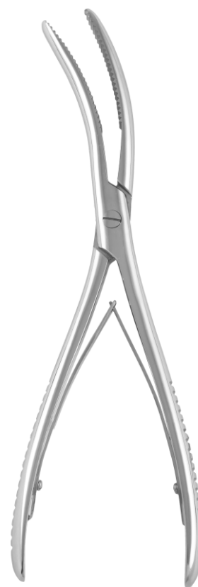
Щипцы для отгибания краев гипсовых повязок Plaster Cast Breaker

24.0109.18* 180 mm 24.0109.20* 200 mm 24.0109.22* 220 mm 24.0109.24* 240 mm 24.0109.26* 265 mm