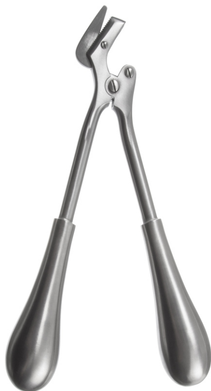
Ножницы для разрезания гипсовых повязок по Stille Stille Plaster Cast Shear

24.0092.20* 200 mm 24.0092.23* 230 mm 24.0092.26* 260 mm 24.0092.30* 300 mm 24.0092.37* 370 mm