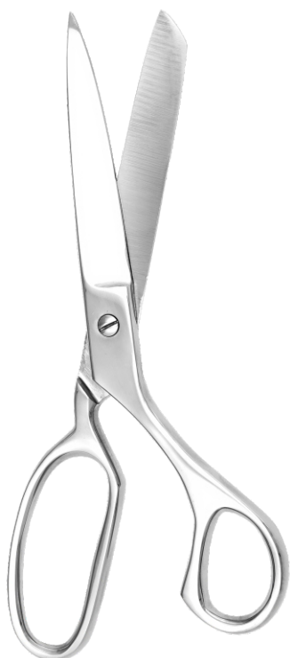
Ножницы для перевязочного материала, прямые Bandage scissors, straight