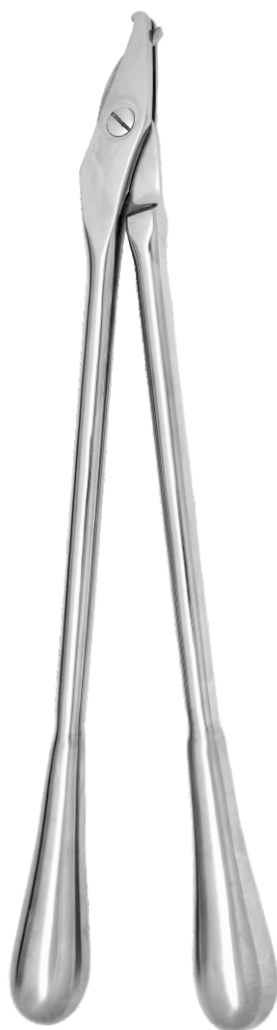
Ножницы для разрезания гипсовых повязок Plaster shears

24.0092.20* 200 mm 24.0092.23* 230 mm 24.0092.26* 260 mm 24.0092.30* 300 mm 24.0092.37* 370 mm