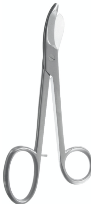
Ножницы для повязок по Брюнсу, гладкие Bruns Bandage Scissors smooth

24.0013.14* 140 mm 24.0013.16* 160 mm 24.0013.19 185 mm 24.0013.20* 200 mm