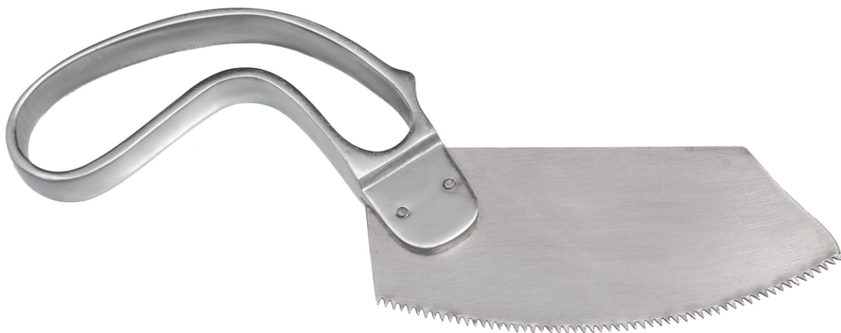
Пила для разрезания гипсовых повязок Plaster saw