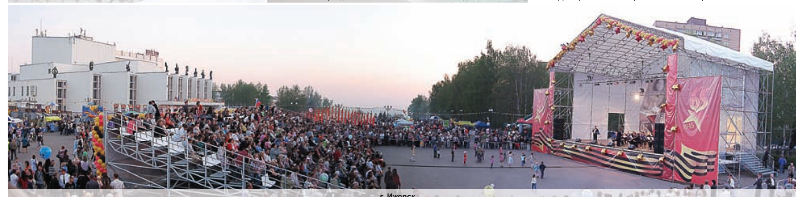
г. Ижевск Центральная площадь