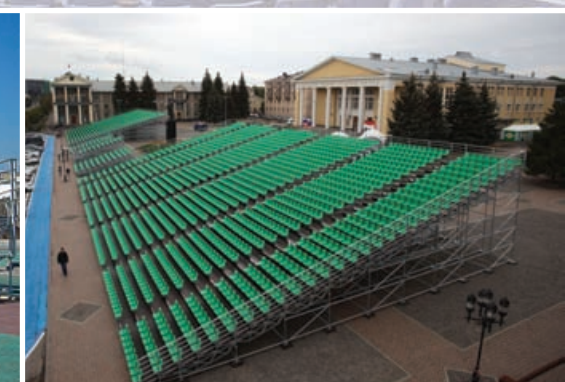
г. Альметьевск, Центральная площадь, День работников нефтяной и газовой промышленности