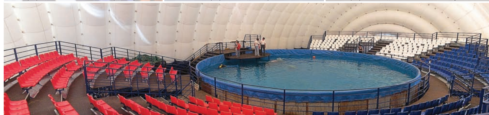
г. Ижевск Передвижной дельфинарий