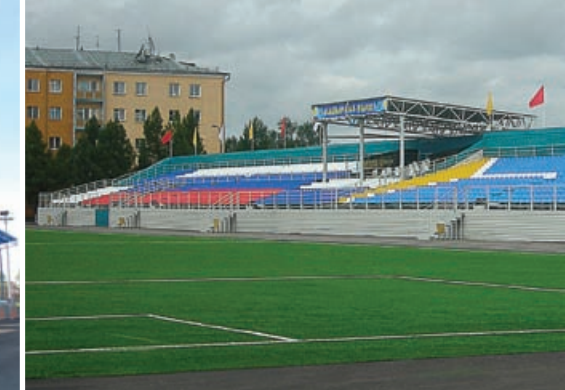
г. Кызыл Центральный стадион им. 5-летия Советской Тувы