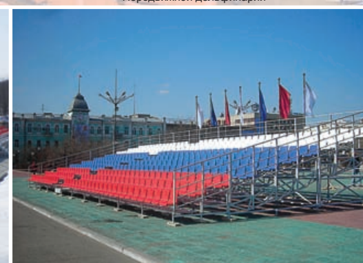
г. Чита Празднование 65-летия Великой Победы