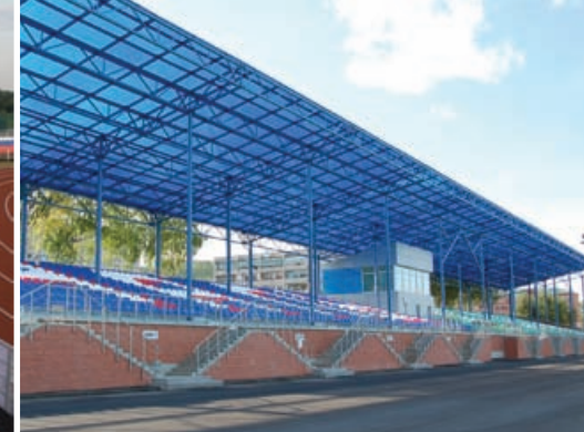
г. Учалы Центральный стадион «Горняк»