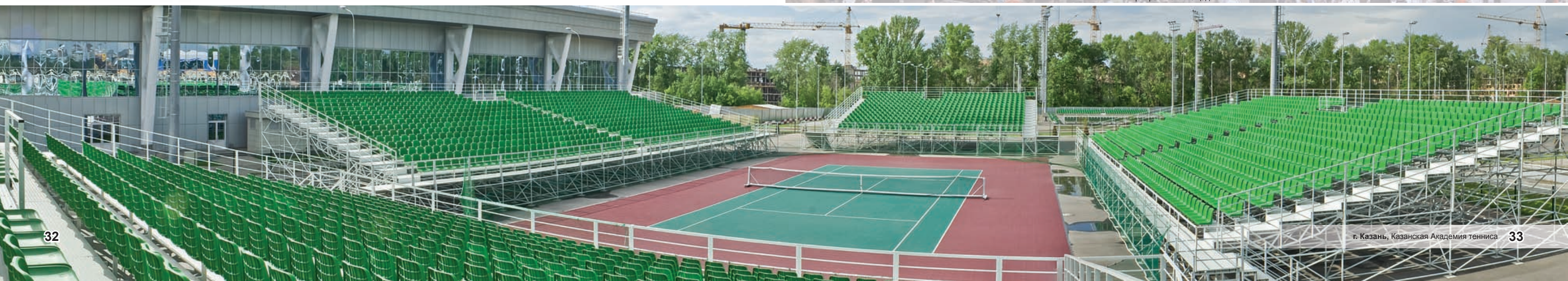
г. Казань, Казанская Академия тенниса