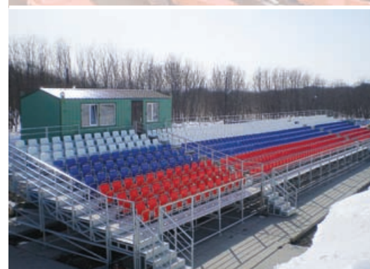
г. Петропавловск-Камчатский Биатлонный комплекс