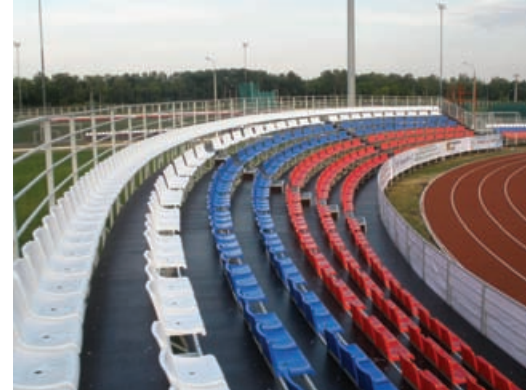
г. Саранск Центр подготовки по летним видам спорта «Старт»