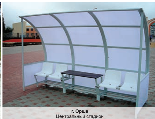
г. Орша Центральный стадион