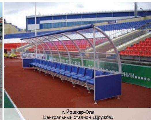
г. Йошкар-Ола Центральный стадион «Дружба»