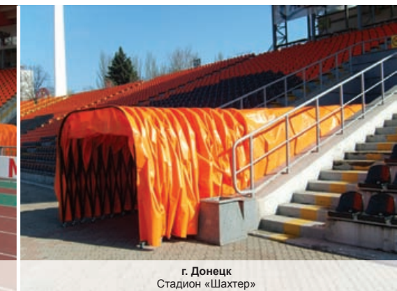
г. Донецк Стадион «Шахтер»