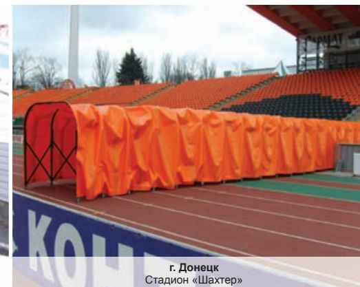
г. Донецк Стадион «Шахтер»