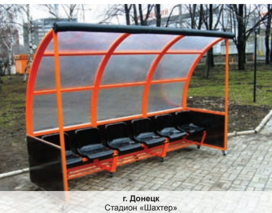
г. Донецк Стадион «Шахтер»