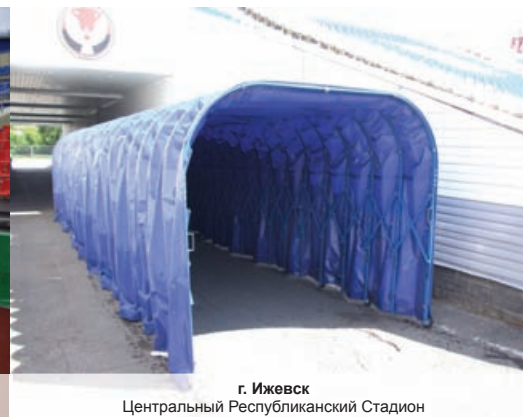
г. Ижевск Центральный Республиканский Стадион