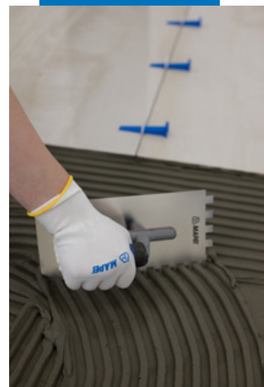
Укладка на пол керамогранита размером 160 x 80 см

В случае сильно впитывающих оснований и высоких температур рекомендуется смочить основание или применить соответствующую грунтовку перед нанесением Ultraflex S2 , чтобы продлить открытое время клея.