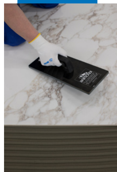
Укладка керамогранита размером 240 x 120 см.