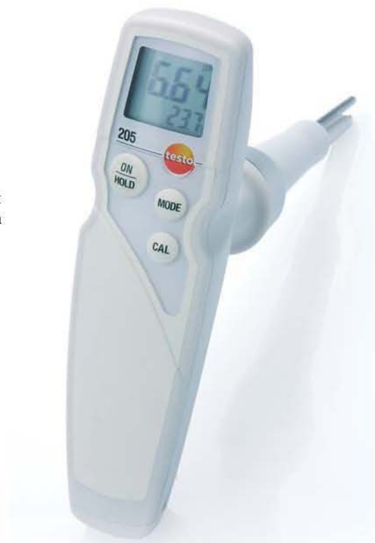
Прочный пищевой зонд pH/°C. Измерительный инструмент с автоматической температурной компенсацией.