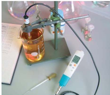
testo 206-pH3 обеспечивает подсоединение внешних зондов