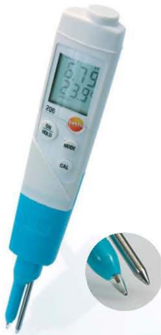
pH2 наконечник зонда для полутвердых субстанций