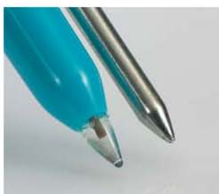
pH2 наконечник зонда для полутвердых субстанций

Совместно с экспертами из области промышленности и сферы продаж, компания Testo разработала инновационные решения.