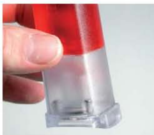
Хлорид калия, связанный в гель. Не вытекает из емкости.

Testo, со своим гелем для хранения, устранило этот недостаток. Раствор хлорида кальция поставляется в контейнере в виде геля. То что не капает, не может и вытечь!