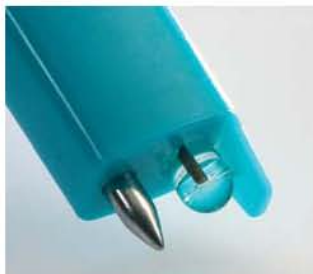
pH1 наконечник зонда для жидкостей

Измерение значений pH играет важную роль во многих сферах. Где бы не происходила химическая или биохимическая реакция, значение pH является важным индикатором процесса.