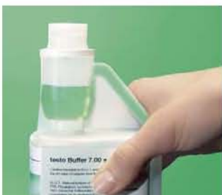
pH буферный раствор в бутылочке с дозирующим контейнером