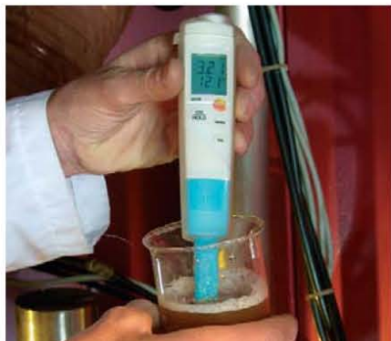
testo 206- pH1 идеален для измерений в жидкостях