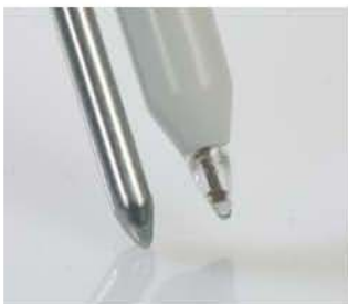
pH наконечник, вставленный в прочный пластик