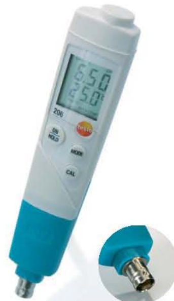
pH3 наконечник с BNC интерфейсом