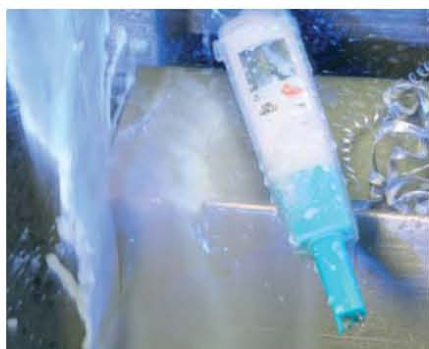
Чехол TopSafe защищает даже в промышленных условиях