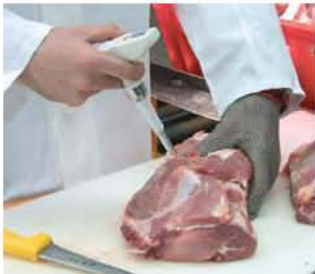
Быстрые и удобные измерения во время производства