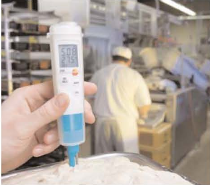
Автоматическое распознавание значения полной шкалы и четкий 2-х строчный дисплей.