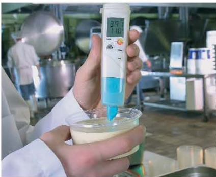
testo 206-pH2 идеален для измерения в полутвердых веществах