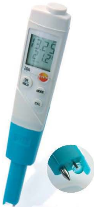
pH1 наконечник зонда для жидкостей