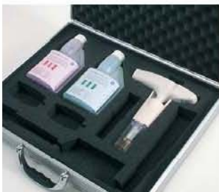
Комплект в кейсе с testo 205, pH 4.0 и 7.0 буферными растворами и колпачком для хранения