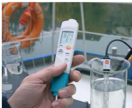
Автоматическая температурная компенсация во внешних зондах с сенсором температуры