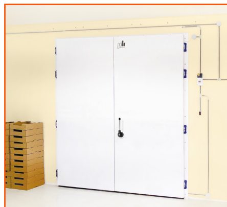
Рисунок 1. Распашная двустворчатая дверь

✓ Замок STUV или Rahrbach (Германия) может устанавливаться на холодильные и морозильные двери до 5 метров высотой за счет дополнительной точки закрытия