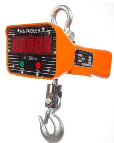
Рисунок 2. Общий вид весов крановых OCS

Общий вид весов представлен на рисунке 2.