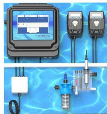
PH/CLORO WITHPOTENTIOSTATICCELL PUMPSMODELMP2-HT

Возможность персонализации с различными моделями перистальтических или электромагнитных дозирующих насосов. Изготовленные в соответствии с лучшими стандартами качества и эффективности, системы POOLTEC полностью производятся в Италии.