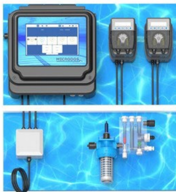
PH/COLOR WITH AMPEROMETRIC CELL PUMPS MODEL MP2-HT