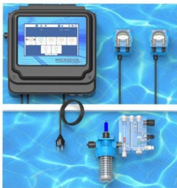
PH/CLORO WITHAMPEROMETRICCELL PUMPSMODELMP2-B