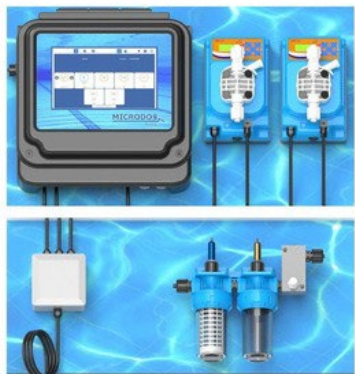
PH/REDOX WITH PH/ORPPROBES PUMPSMODEL ME3