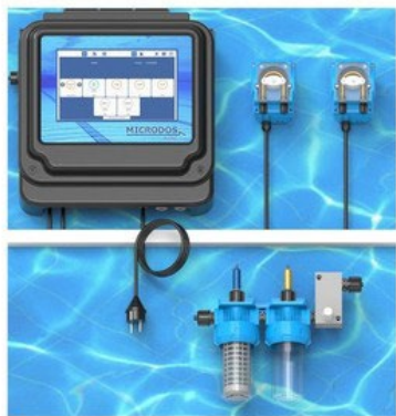
PH/REDOX WITH PH/ORP PROBES PUMPS MODEL MP2-B