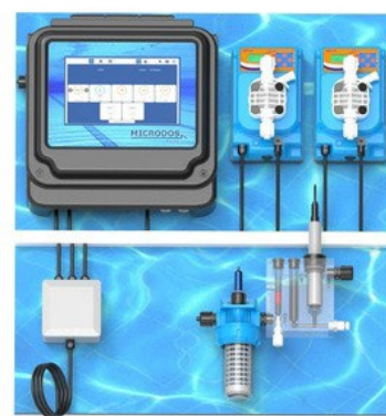
PH/COLOR WITH POTENTIOSTATIC CELL PUMPS MODEL ME3