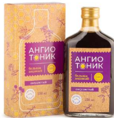
Бальзам «Ангиотоник» (сосудистый)