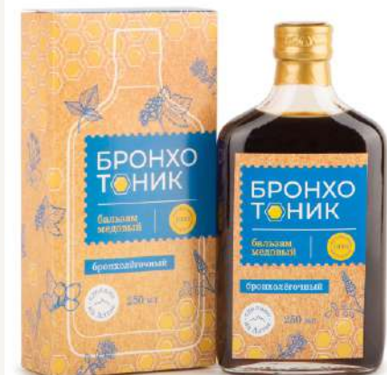
Бальзам «Бронхотоник» (bronхолегочный)