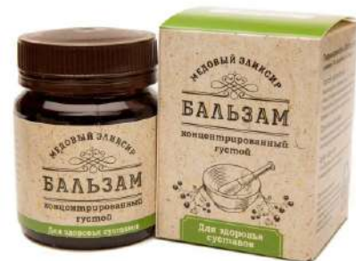
Медовый эликсир для здоровья суставов