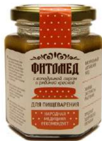
Фитомед для пищеварения