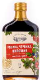
Сироп «Шиповник, рябина»