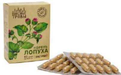
Корень лопуха, экстракт