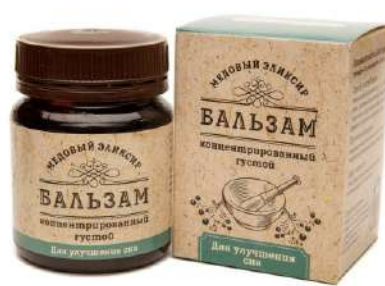
Медовый эликсир для улучшения сна