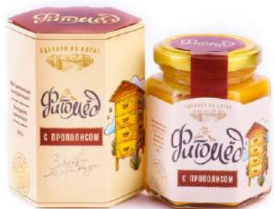
Фитомёд с прополисом