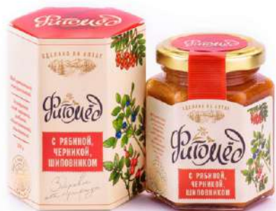
Фитомёд с шиповником, рябиной и черникой