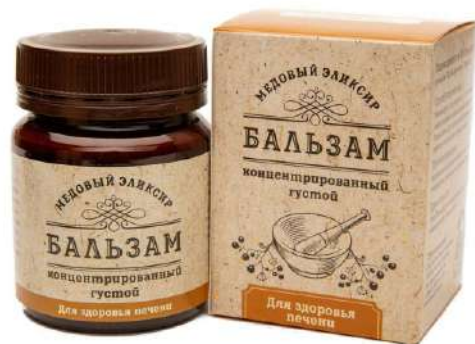
Медовый эликсир для здоровья печени