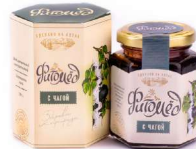
Фитомед с чагой