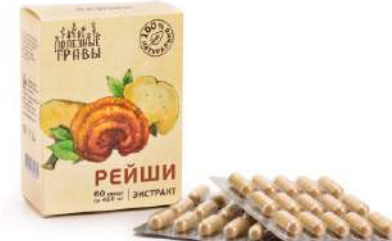
Гриб рейши, экстракт