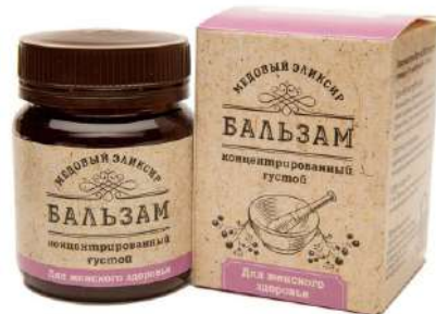
Медовый эликсир для женского здоровья