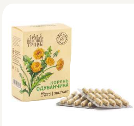
Шлемник Байкальский, экстракт