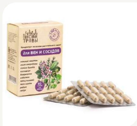
Для вен и сосудов