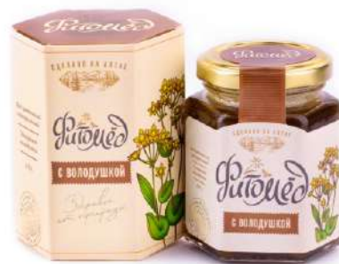
Фитомед с володушкой