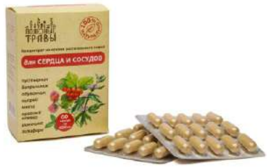
Комплекс для сердца и сосудов