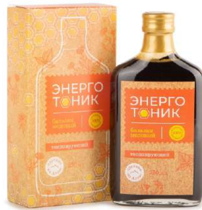
Бальзам «Энерготоник» (тонизирующий)