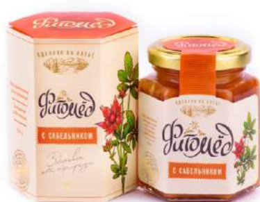
Фитомед с сабельником