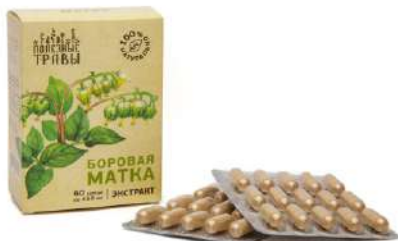
Боровая матка, экстракт