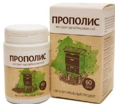
Прополис (экстракт адсорбированный)