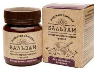
Медовый эликсир для мужского здоровья