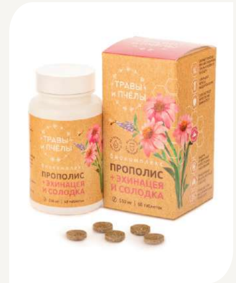
Прополис+Соладка и эхинацея