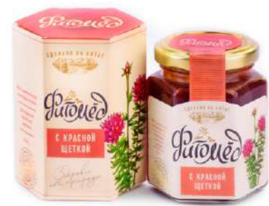
Фитомед с красной щеткой