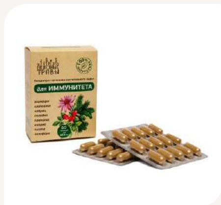
Комплекс для иммунитета