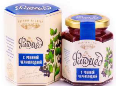
Фитомёд с рябиной черноплодной