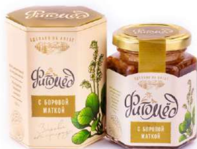
Фитомёд с боровой маткой