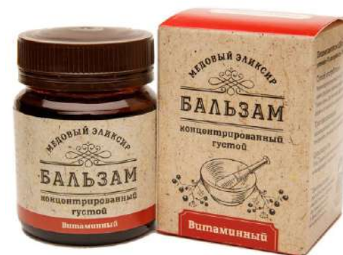
Медовый эликсир витаминный