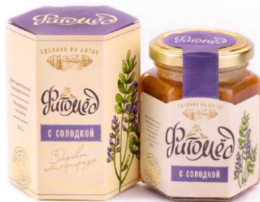
Фитомед с солодкой