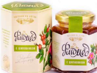
Фитомёд с шиповником