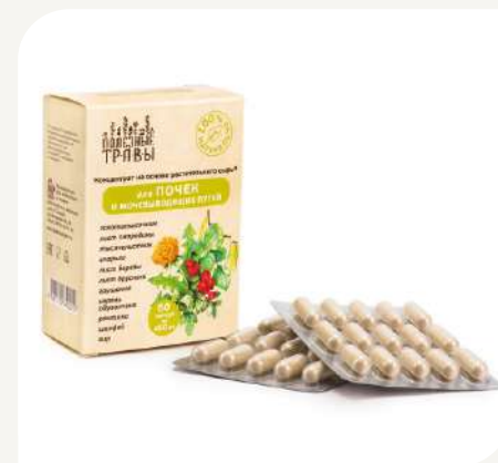
Для почек и мочевыводящих путей