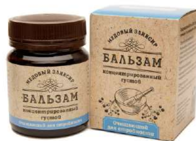
Медовый эликсир очищающий Для стройности