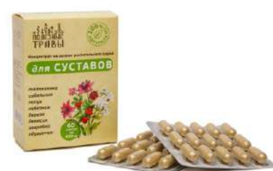
Комплекс для суставов