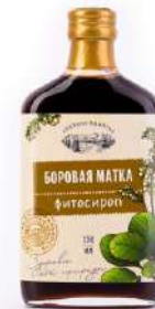
Сироп «Боровая матка»