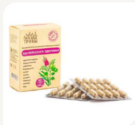
Для мужского здоровья