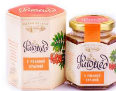
Фитомёд с рябиной красной