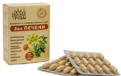
Комплекс для печени