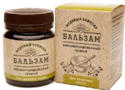
Медовый эликсир для здоровья почек