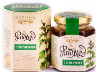
Фитомед с пустырником