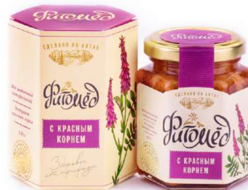
Фитомед с красным корнем