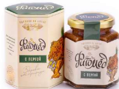
Фитомёд с пергой