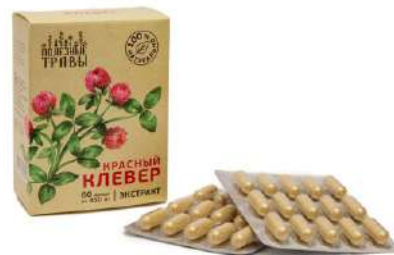
Красный клевер, экстракт