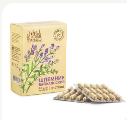
Шлемник Байкальский, экстракт