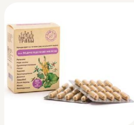
Для поджелудочной железы