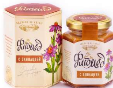
Фитомед с эхинацеей