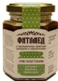
Фитомед при гипертонии