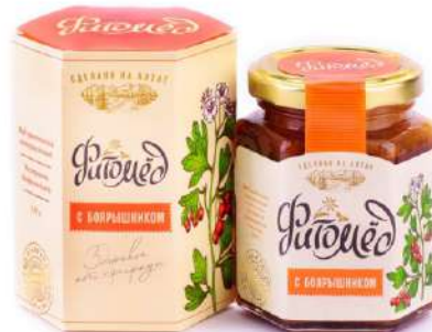
Фитомёд с боярышником