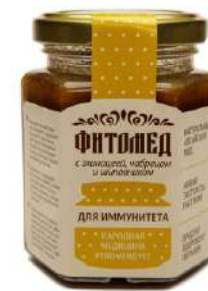
Фитомед для иммунитета