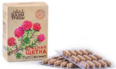
Красная щетка, экстракт