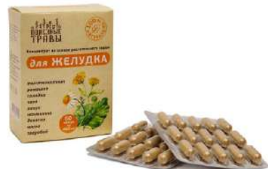
Комплекс для желудка