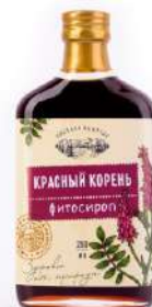
Сироп «Красный корень»