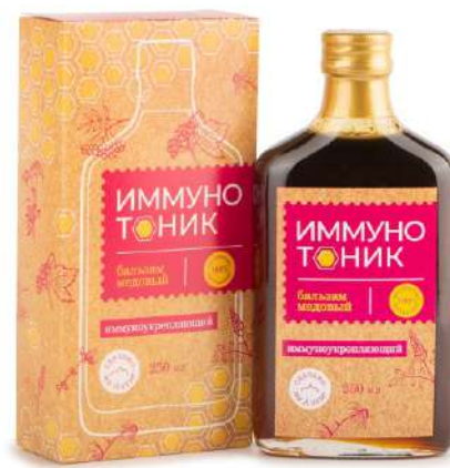
Бальзам «Иммунотоник» (иммуностимулирующий)