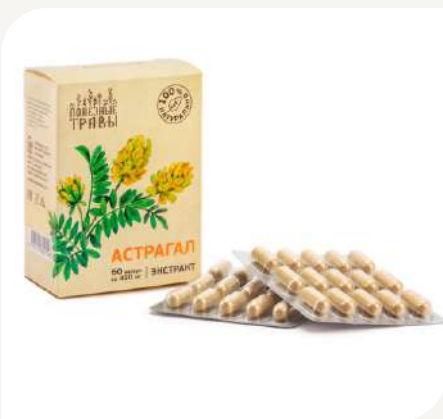
Астрагал , экстракт