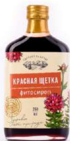
Сироп «Красная щетка»