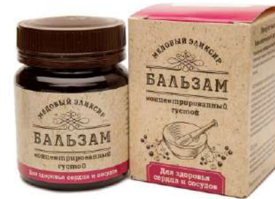
Медовый эликсир для здоровья сердца и сосудов