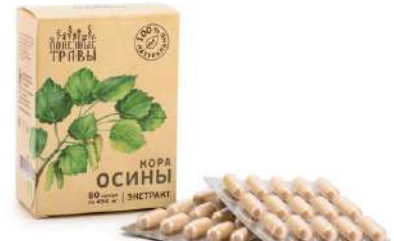
Кора осины, экстракт