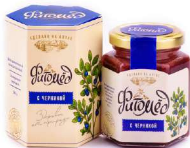
Фитомёд с черникой