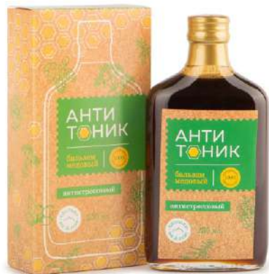
Бальзам «Антитоник» (успокаивающий)