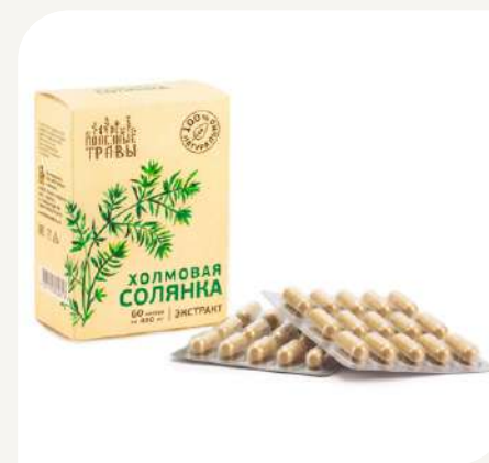
Солянка холмовая экстракт