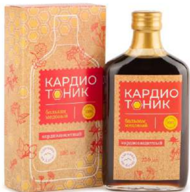
Бальзам «Кардиотоник» (кардиозащитный)