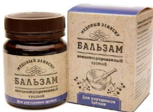
Медовый эликсир для зрения