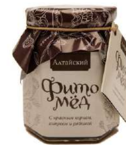
Фитомед Алтайский с красным корнем