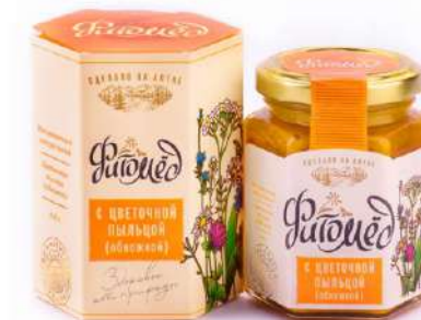
Фитомёд с обножкой (цветочной пылью)