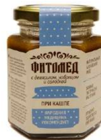
Фитомед при кашле