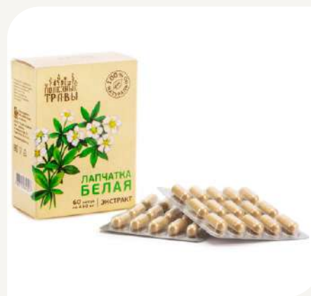
Лапчатка белая, экстракт