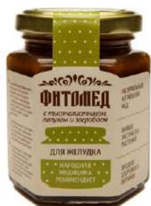
Фитомед для желудка