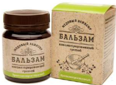
Медовый эликсир против простудный