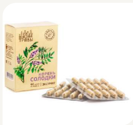
Корень солодки, экстракт