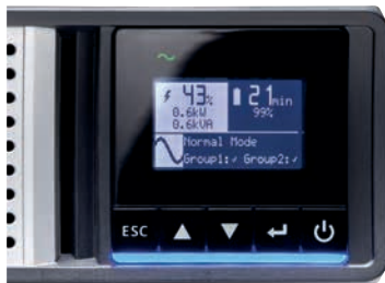
Интуитивно понятный ЖК-дисплей упрощает настройку и управление