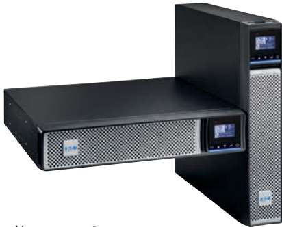
УНИВЕРСАЛЬНЫЙ ФОРМ-ФАКТОР «СТОЙКА/БАШНЯ»