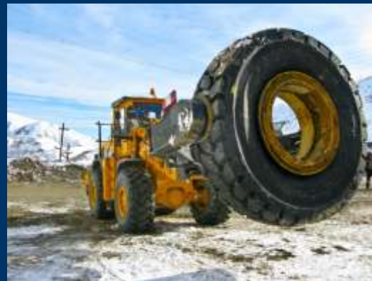
Шиноманипулятор на базе 534E

(максимальный радиус шин - 45/65-51; 36.00 R51)