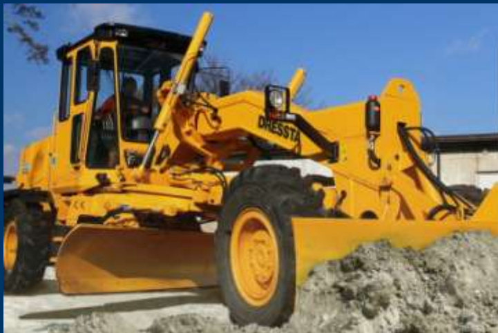
RD-165 C/H Extra