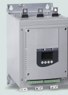
Устройство плавного пуска