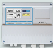
Пульт управления и защиты