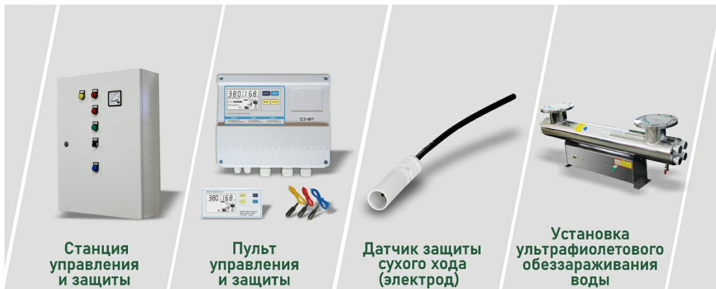
Станция управления и защиты