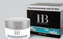
Артикул № 135