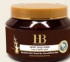
Артикул № 311