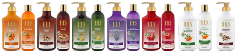
Артикул № 319 - 780ml, 324 - 400ml, Артикул № 327 - 780ml, 330 - 400ml, Артикул № 320 - 780ml, 323 - 400ml, Артикул № 321 - 780ml, 326 - 400ml, Артикул № 331 - 780ml, 329 - 400ml, Артикул № 322 - 780ml, 325 - 400ml, Артикул № 333 - 780ml