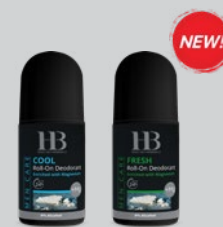
Артикул № 589-590

Освежающий крем-дезодорант для ног для мужчин