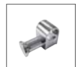
Optionals pag. 173

ACCESSORI DISPONIBILI A RICHIESTA OPTIONALS AVAILABLE ON REQUEST ДОПОЛНИТЕЛЬНЫЕ ОПЦИИ