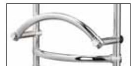
Optionals pag. 176