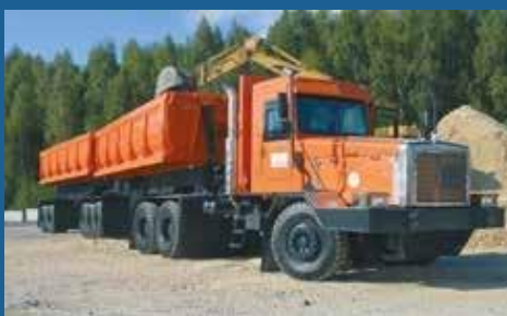
ВНЕДОРОЖНЫЕ ТЯГАЧИ И АВТОПОЕЗДА