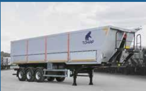
ЗЕРНОВОЗЫ И КАРТОФЕЛЕВОЗЫ