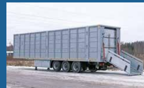
ПОЛУПРИЦЕПЫ ДЛЯ ПЕРЕВОЗКИ СКОТА И ПТИЦЫ