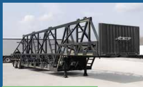
ПОЛУПРИЦЕПЫ ДЛЯ ПЕРЕВОЗКИ КРУПНОГАБАРИТНЫХ ШИН