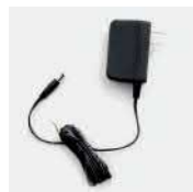
Адаптер питания PS1026