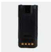
Литий-ионный аккумулятор BL1815-EX