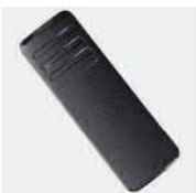
Зажим для крепления к поясному ремню BC39