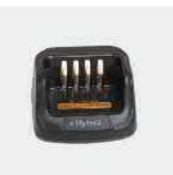
Зарядное устройство CH10L27