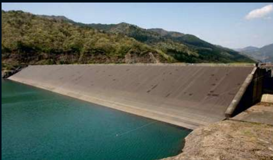
ПЛОТИНЫ И ДАМБЫ ГРУНТОВЫЕ