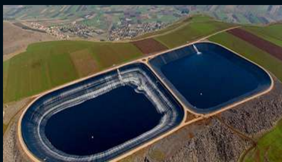
ШЛАМОНАКОПИТЕЛИ И И ЗОЛОТОВАЛЫ