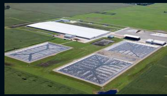
ЛАГУНЫ ДЛЯ ОБЪЕКТОВ СЕЛЬСКОГО, ЖИВОТНОВОДЧЕСКОГО И РЫБОВОДЧЕСКОГО ХОЗЯЙСТВ