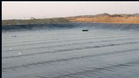
ОБЪЕКТЫ ТБО, ПОЛИГОНЫ ТВЕРДЫХ/ ЖИДКИХ ОТХОДОВ