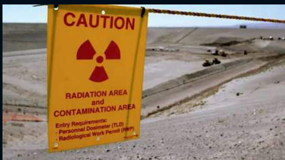
МОГИЛЬНИКИ ТОКСИЧНЫХ И РАДИОАКТИВНЫХ ОТХОДОВ