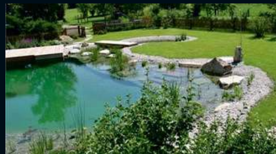
ИСКУССТВЕННЫЕ ВОДОЕМЫ, ЛАНДШАФТНОЕ СТРОИТЕЛЬСТВО