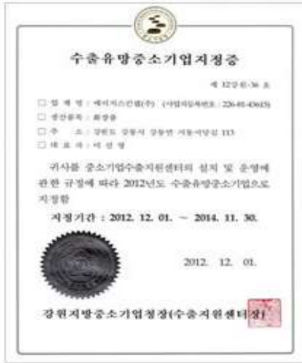
수출 유망 중소기업